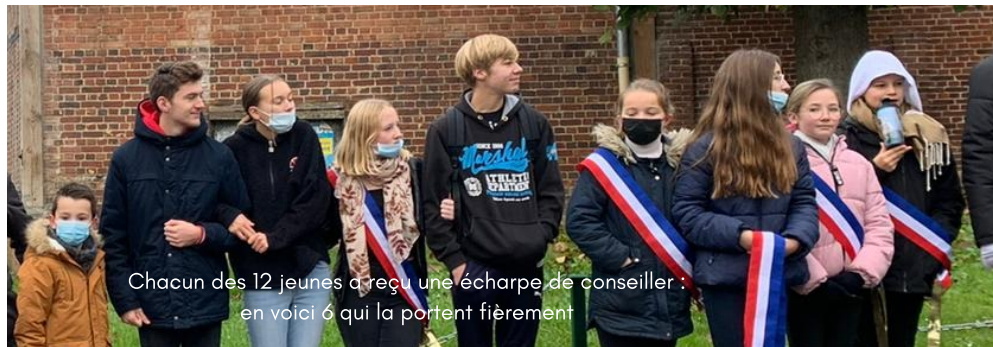
Chacun des 12 jeunes a reçu une écharpe de conseiller : en voici 6 qui la portent fièrement

Nous, les ados et pré-ados du CMJ, avons décidé de mener plusieurs projets pour la commune : les décorations de Noël que vous avez pu voir ou un grand projet d'aménager du stade pour la commune. Nous participons à la vie citoyenne comme la commémoration du 11 novembre.