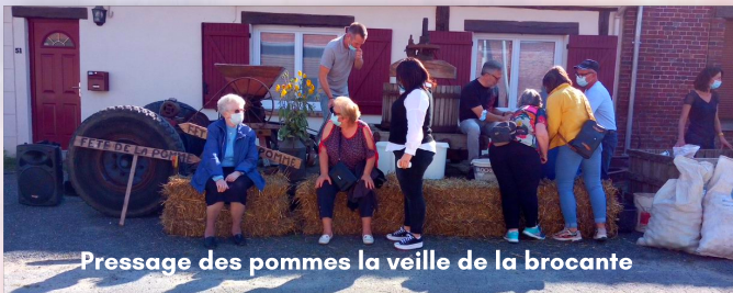
Pressage des pommes la veille de la brocante

En témoignent les diverses festivités construites avec nos moyens, de la Fête de la Pomme à celle du Camping inauguré en juillet dernier en passant par la brocante, à la future soirée expérimentale « Tartiflette-Karaoké » qui a dû être décalée pour mieux revenir aux beaux jours !