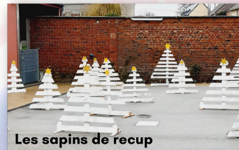
Les sapins de récup

Cette philosophie se traduit également au quotidien depuis peu par les actions menées par le Conseil municipal des Jeunes, notamment son sapin « garantie imputrescible » et confectionné pour durer, mais aussi par les palettes sublimes par notre agent technique Steve Horneec en sapins proposés à tous les habitants qui le souhaitent pour mettre en valeur nos rues, à coûts réduits.