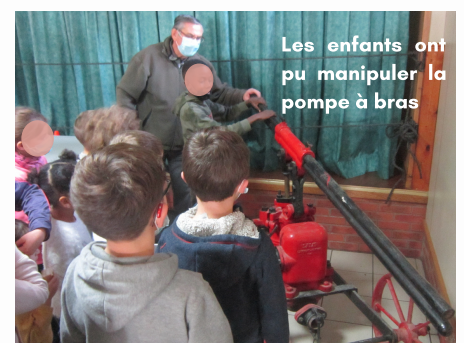
Les enfants ont pu manipuler la pompe à bras

Ils ont reconnu l'immense travail de recherche minutieux et complet que nous avons réalisé. Ils ont aimé la façon de présenter les documents ainsi que les nombreux objets prêtés par des habitants et des personnes de l'extérieur. Tout le monde a pu y trouver son compte, des plus âgés aux plus jeunes. Nous avons même réussi à émouvoir les anciens pompiers du cru en leur rappelant le temps de leur engagement. Merci à notre secrétaire de Mairie de nous avoir mis « le pied à l'étrier » Nous avons commencé notre action par une brève animation auprès de la vingtaine d'enfants qui déjeunent le midi à la salle : ils ont été heureux de pouvoir manipuler la pompe à bras prêtée par le CPI de Bulles et de découvrir la moto-pompe acquise en 1939, nettoyée par quelques membres de l'Amicale et notre employé communal. L'an prochain, nous vous attendons encore plus nombreux pour une nouvelle aventure.