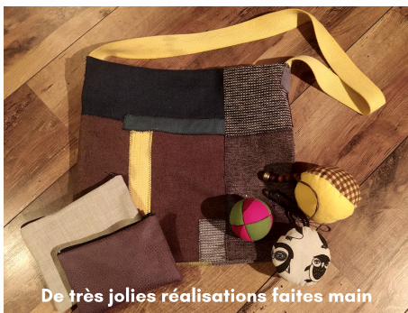
De très jolies réalisations faites main

Parmi les objets mis en exposition : boules de Noël, objets confectionnés, sacs à main, pochettes, décorations, calendriers de l'aveugle en tissu, ... De quoi décorer la maison pour les fêtes et garnir le pied du sapin de jolis cadeaux!