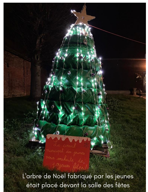
L'arbre de Noël fabriqué par les jeunes était placé devant la salle des fêtes