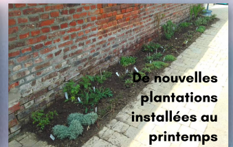
De nouvelles plantations installées au printemps