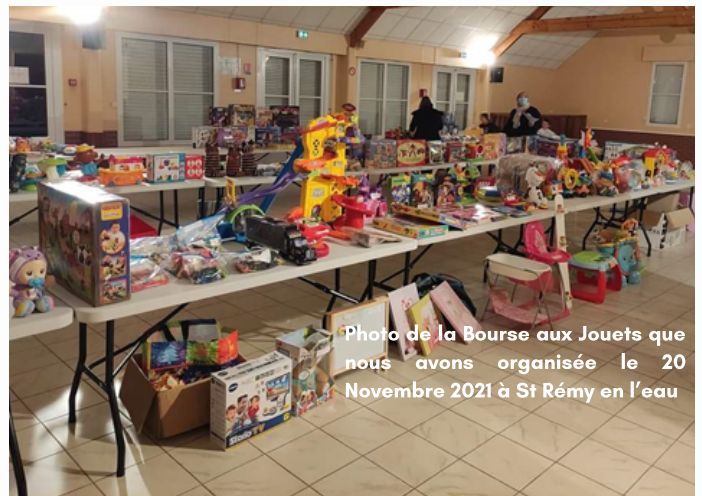
Photo de la Bourse aux Jouets que nous avons organisée le 20 Novembre 2021 à St Rémy en l'eau

L'association LA JOYEUSE RIBAMBELLE a fait sa rentrée des classes avec notamment l'Assemblée Extraordinaire le 9 Octobre 2021. Lors de celle-ci, les membres du bureau ont été réélus pour un nouveau mandat avec plusieurs idées d'animations pour l'année à venir : tombola, loto pour enfants, chasse aux trésors... Nous sommes malheureusement dépendants des conditions sanitaires mais nous ne manquerons pas de vous tenir informés de nos projets. Les bénéficiaires de l'ensemble de nos événements permettront d'offrir un voyage de fin d'année à l'ensemble des élèves scolarisés du RPI.