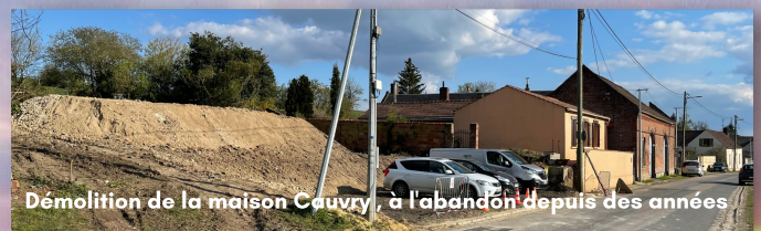
Démolition de la maison Cauvry, à l'abandon depuis des années

Par ailleurs, l'entretien général du village, de l'embellissement de notre cadre de vie et sa sécurisation, nécessite des arbitrages ardues afin de prioriser dans chaque décision le bien commun, tout en maîtrisant les dépenses au strict nécessaire.