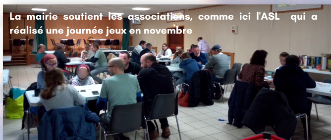
La mairie soutient les associations, comme ici l'ASL qui a réalisé une journée jeux en novembre