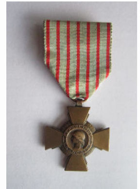
Croix du combattant d'André GONTIER

(*) De l'occupation à la libération - 2011